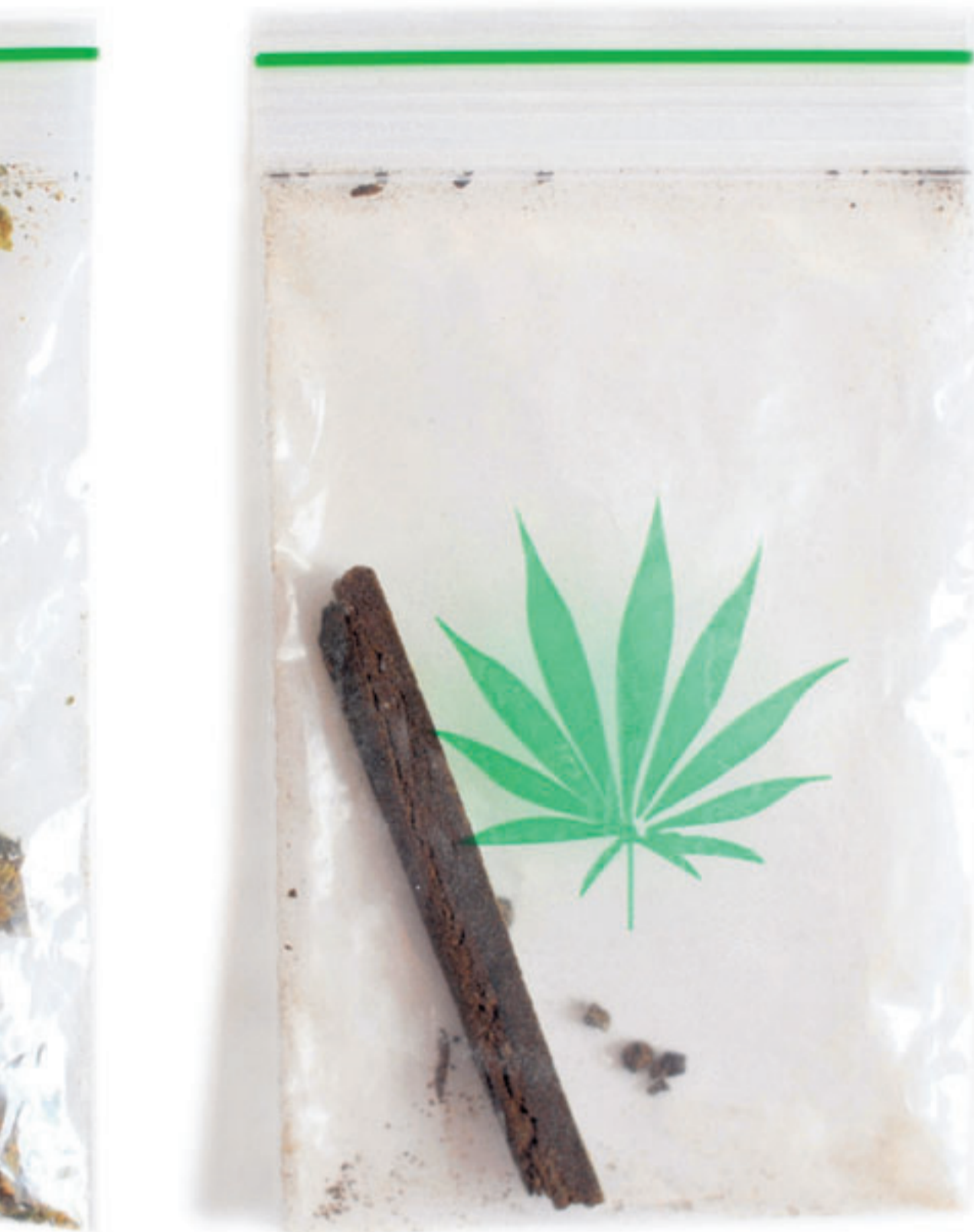
toegenomen,' aldus psychiater Lieuwe de Haan.